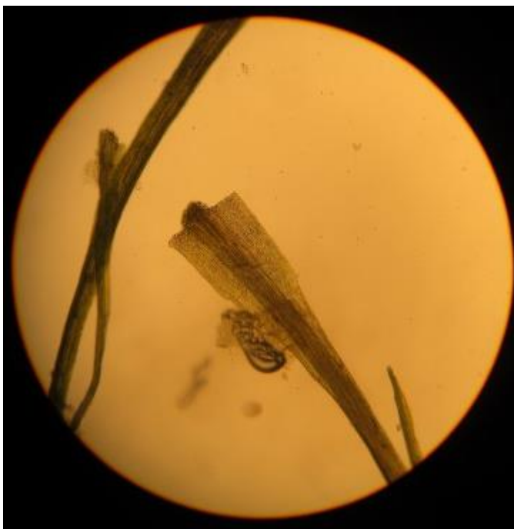
Gewoon veenmos – sphagnum palustre