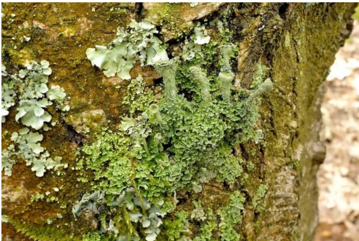
Boven fijn bekermos