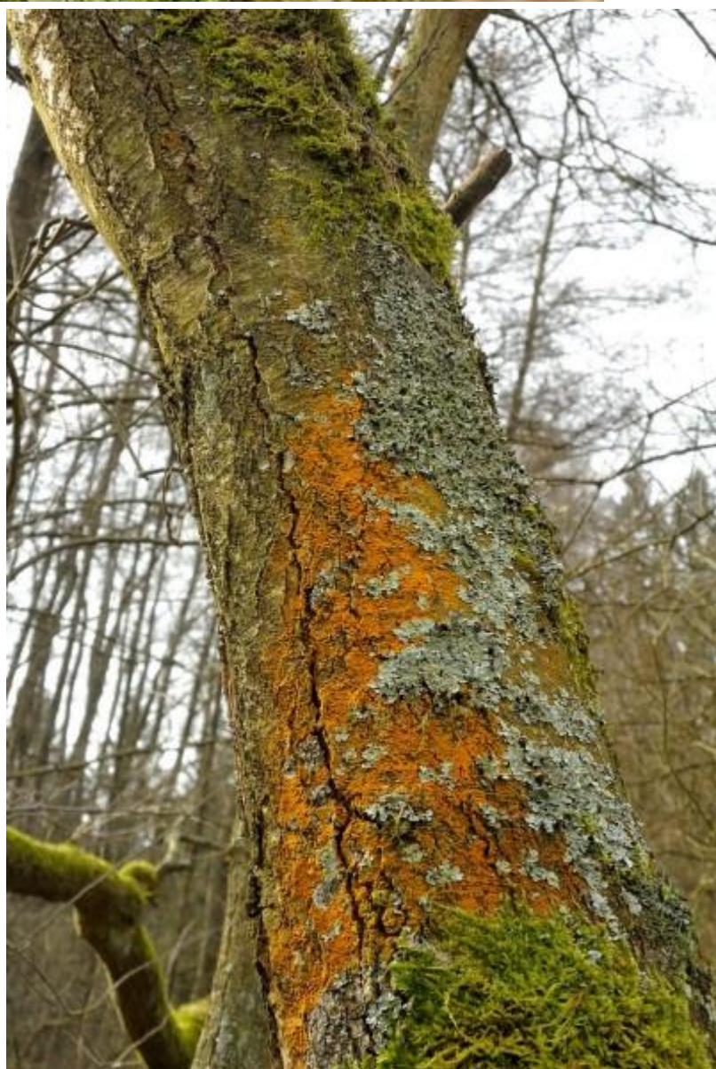
Rechts trentepholia en hoofdzakelijk gebogen schildmos